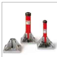
Stützplatten sind als Zubehör erhältlich