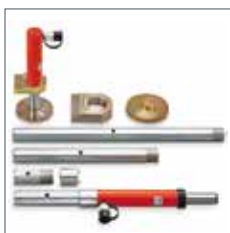
Hubklauen, Kolbenplatten, Bodenadapter und Verlängerungsrohre sind als Zubehör erhältlich