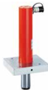
Einschraub-Gewindeflansche sind als Zubehör erhältlich